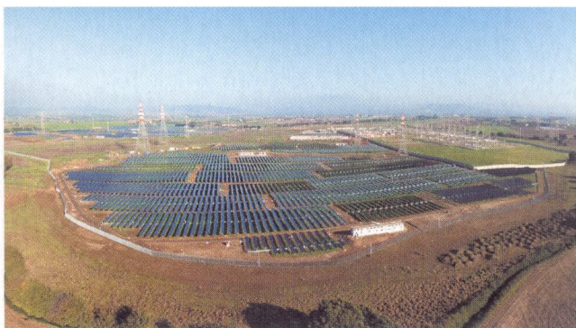
Il primo lotto dei lavori del parco solare di Montalto di Castro, da 24 megawatt di potenza, lascia già intuire le dimensioni dell'opera ultimata.

A ricoprire i ruoli dell'appaltatore generale e del fornitore dei moduli è stata